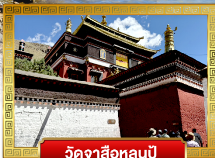
วัดจาซือหลุนปู่