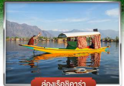
ล่องเรือชิคาร่า